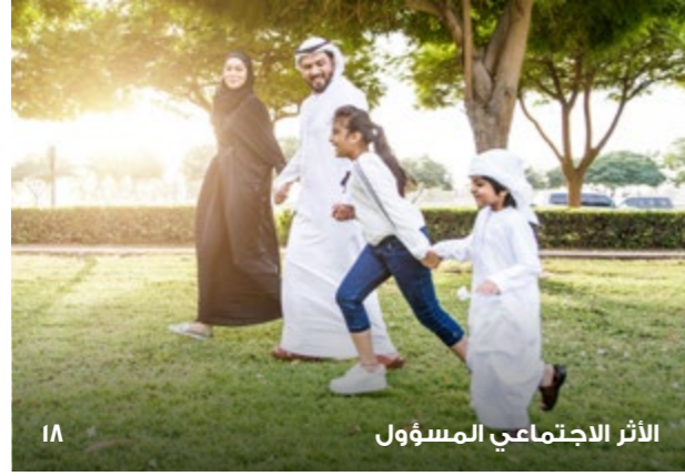
الأثر الاجتماعي المسؤول