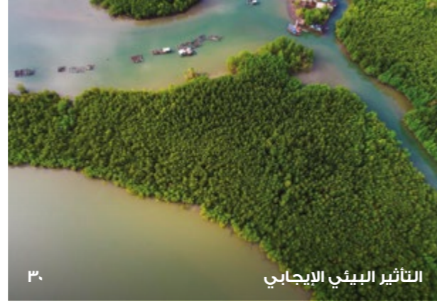
التأثير البيئي الإيجابي